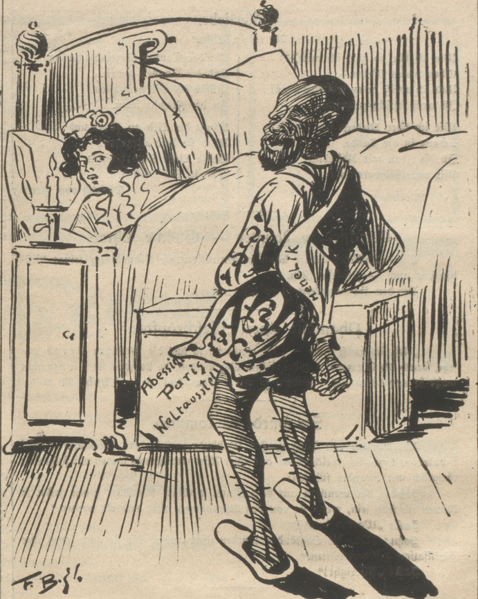
La France (die vergeblich auf fürstliche Besuche zur Ausstellung wartet, erhält den Bericht von Menelik): „Endlich ein Mann!“