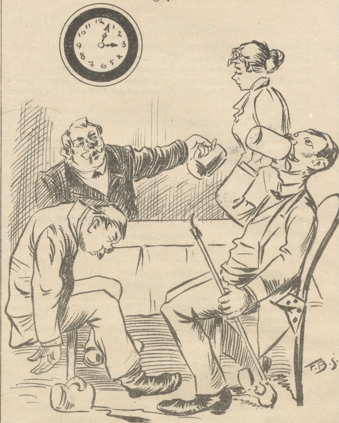
Moderne Schweizer trinken fort und fort wieder eins und — bleiben sitzen.