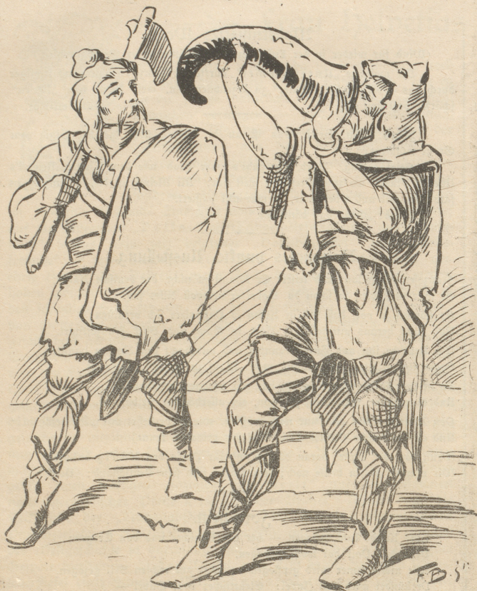
Die alten Schweizer tranken noch eins, ehe sie gingen.