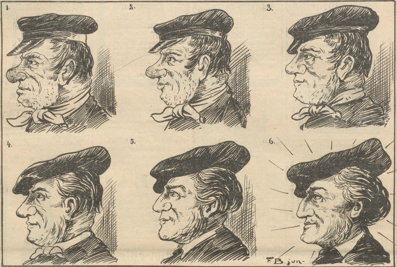
Herrn Bumpfernis äußerliche Wandlungen, nachdem er den abgeschlossenen Wagnercyclus „absolviert“.