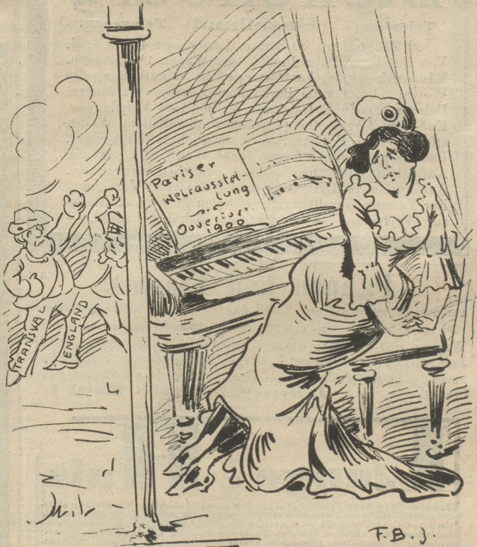
»Mon Dieu! Wenn's keine Ruhe gibt da draußen, kann ich mein Konzert nicht spielen.