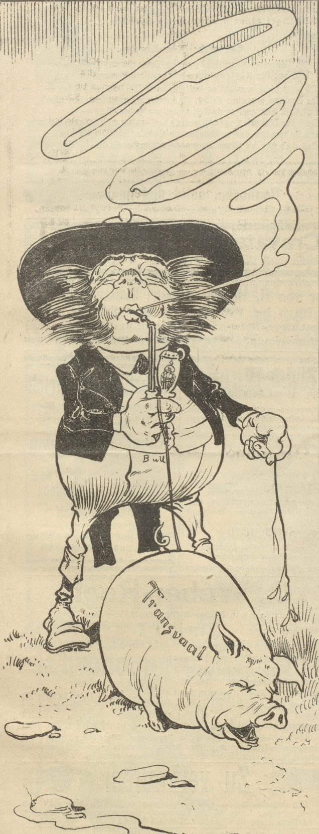
„Grad' wenn er denkt, in aller Ruhe das fette Schwein heimzuführen zu können — — —