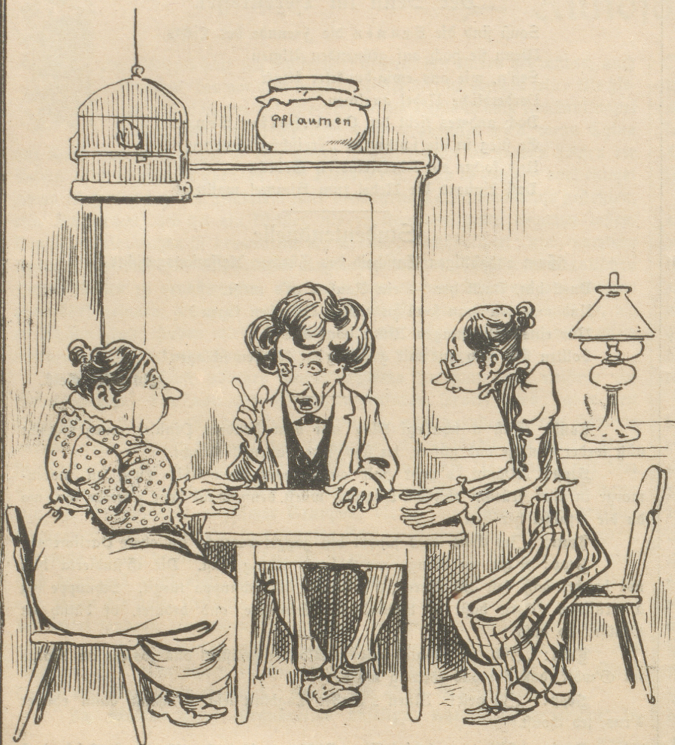
1. „Also, bitte, nur ruhig, wenn sich die Geister kundgeben! — Und nun das Licht löschen!“