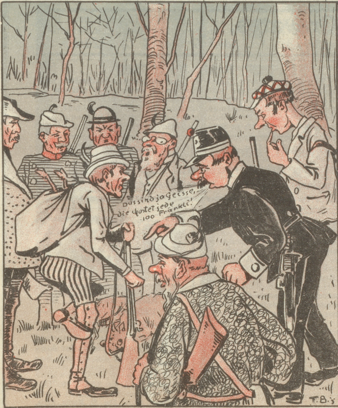
Das Jage-n und Fische-n icht mi Freud', Doch icht das cheibe tüür, bim Eid!