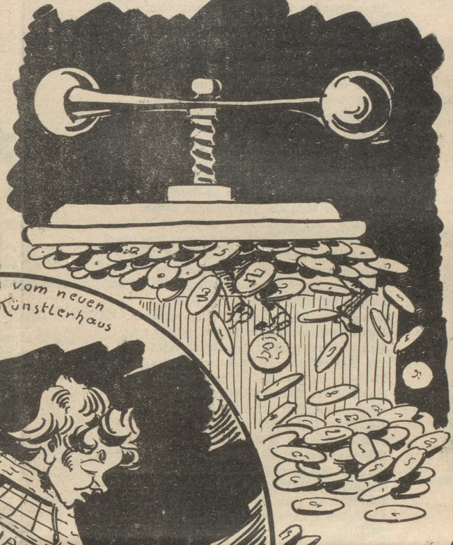
Man hört nichts vom neuen Künstlerhaus