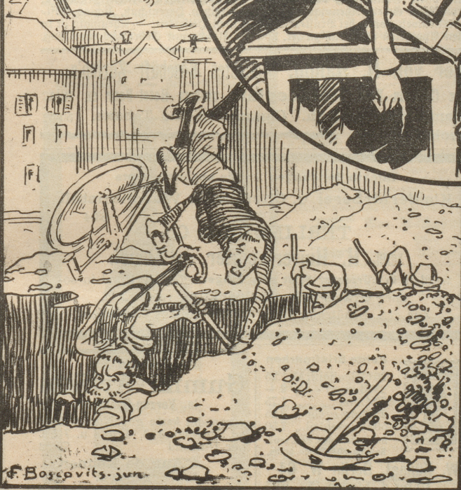
Man schmeckt nichts als Galle u. Bitternis über die ewige Strassenaufgraberei