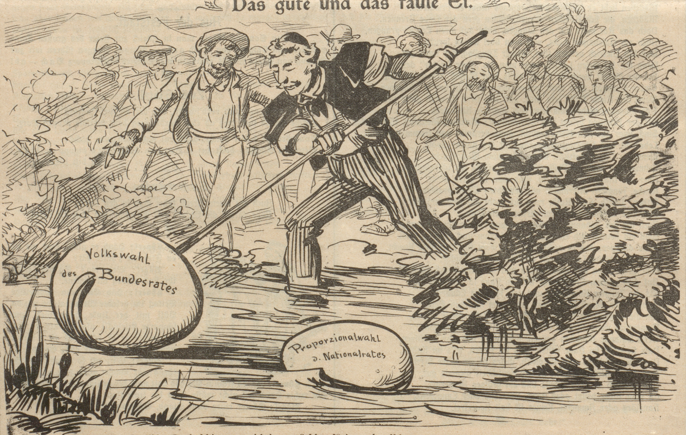
Bravo Ruedi! Du helch's guet richtig erwütscht, für's ander ich es nüt Ichad, es ich doch — es fuul's!