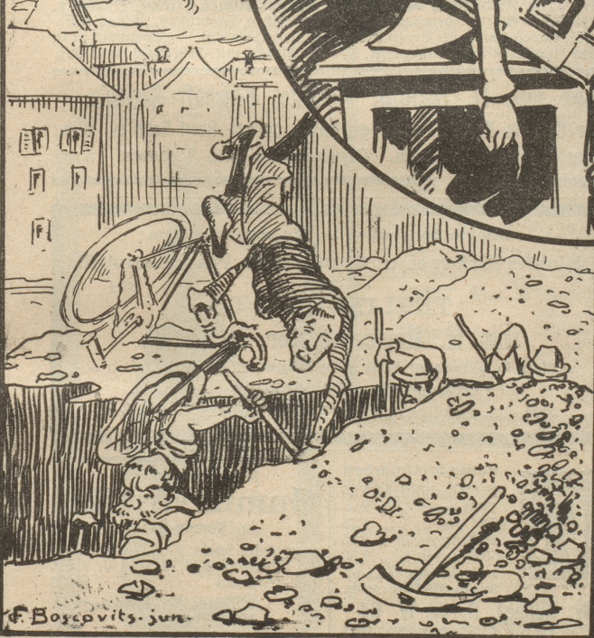
Man schmeckt nichts als Galle u. Bitternis über die ewige Strassenaufgrabere.