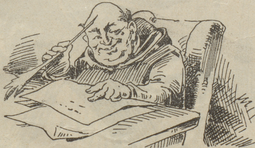
Hochoppril Eytliche vers Ammlung! Hochge Ohrter Her Bresidant!

Anti Ehe Mahlige tags Uzung, jezert Erneierte punters Ammlung ber Antrefe: „Ihn ten Huntstapherrien zu Bärn ihm Jechtlan.“