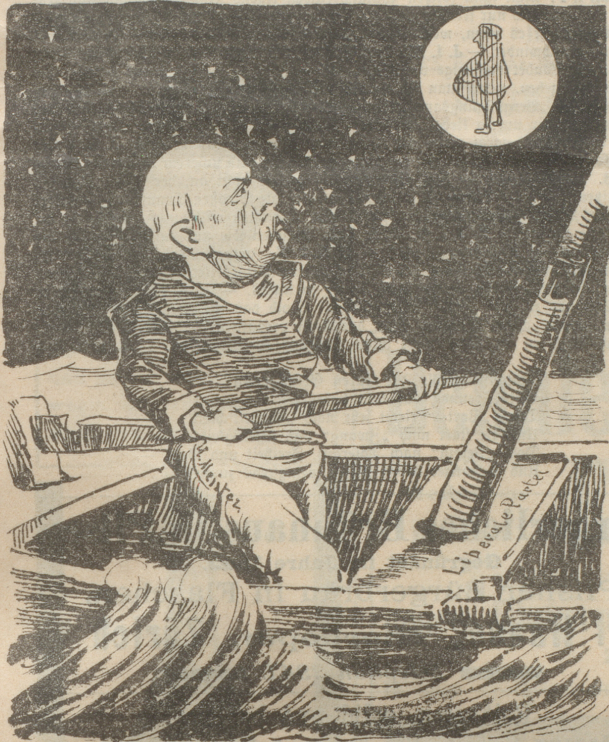
Nach der „N. Z. Z.“ kennt sich der Steuermann sehr gut in den Zeichen des Himmels aus. Was glänzt sein Stern? — „Selber essen macht fett!“