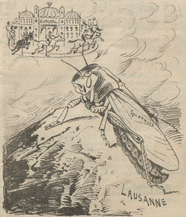
Heupferd (in Lausanne): „Ach, wenn Du wärst mein eigen, wie lieb sollst Du mir sein!“