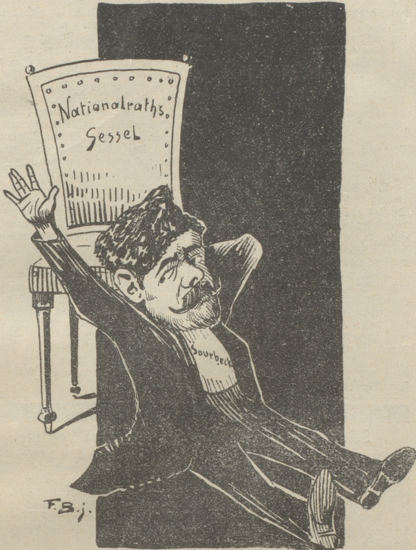
„Die Chräne cinn! Die Erde hat mich wieder!“