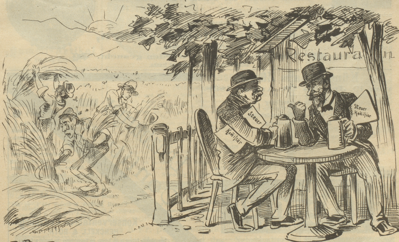
„Bruder, ich denk', es werde am besten sein, energisch vorzugehen. Siehst du, wie sie alle schweigen? In diesem Zustande vertragen sie's am besten, wenn man die Schraube etwas anzieht.“