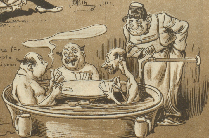
Einrichtung für Stamngäste in der heißen Zeit.