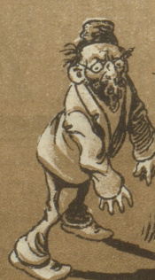
Im Winter is halt Sackbesser. Da wird man Sack nicht so beicht voll!