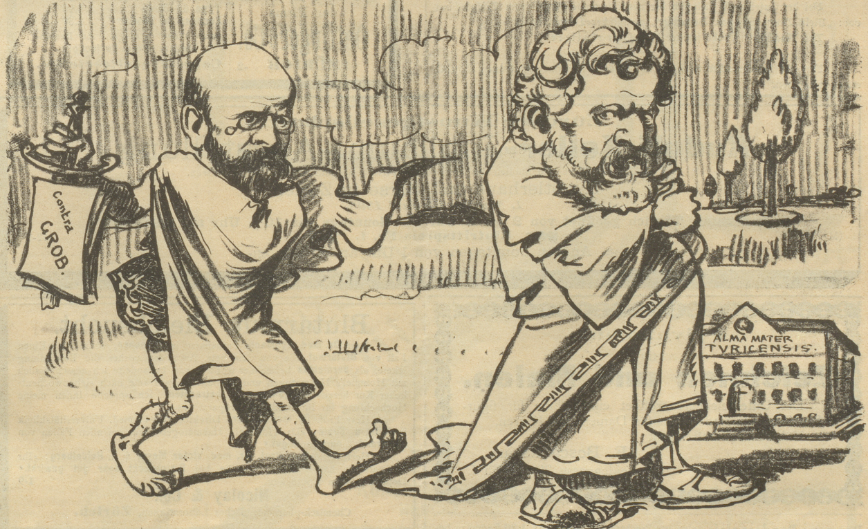
„Was wolltest Du mit dem Dolche, sprich?“ — „Die Hochschule rächen fürchterlich!“ — Da versetzte der and're mit ärger Eist: „Geh' Du nur heim, das nützt Dir niischt! Du mußt den ganzen Kantonsrat ermorden, sonst wird es nimmer besser werden!“