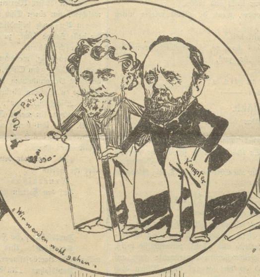
„Wir werden wohl gehen.“