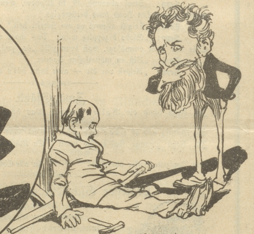
„Merkwürdig, erst 18 Stunden gearbeitet und schon müde!“