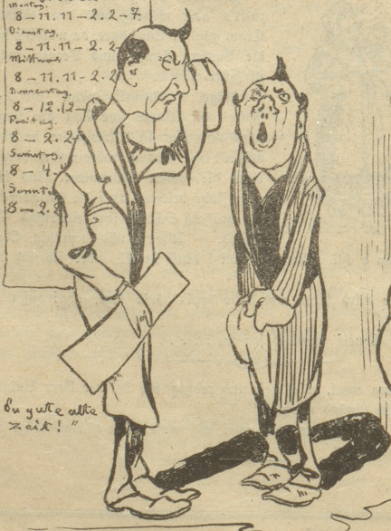
„Du gute alte Zeit!“