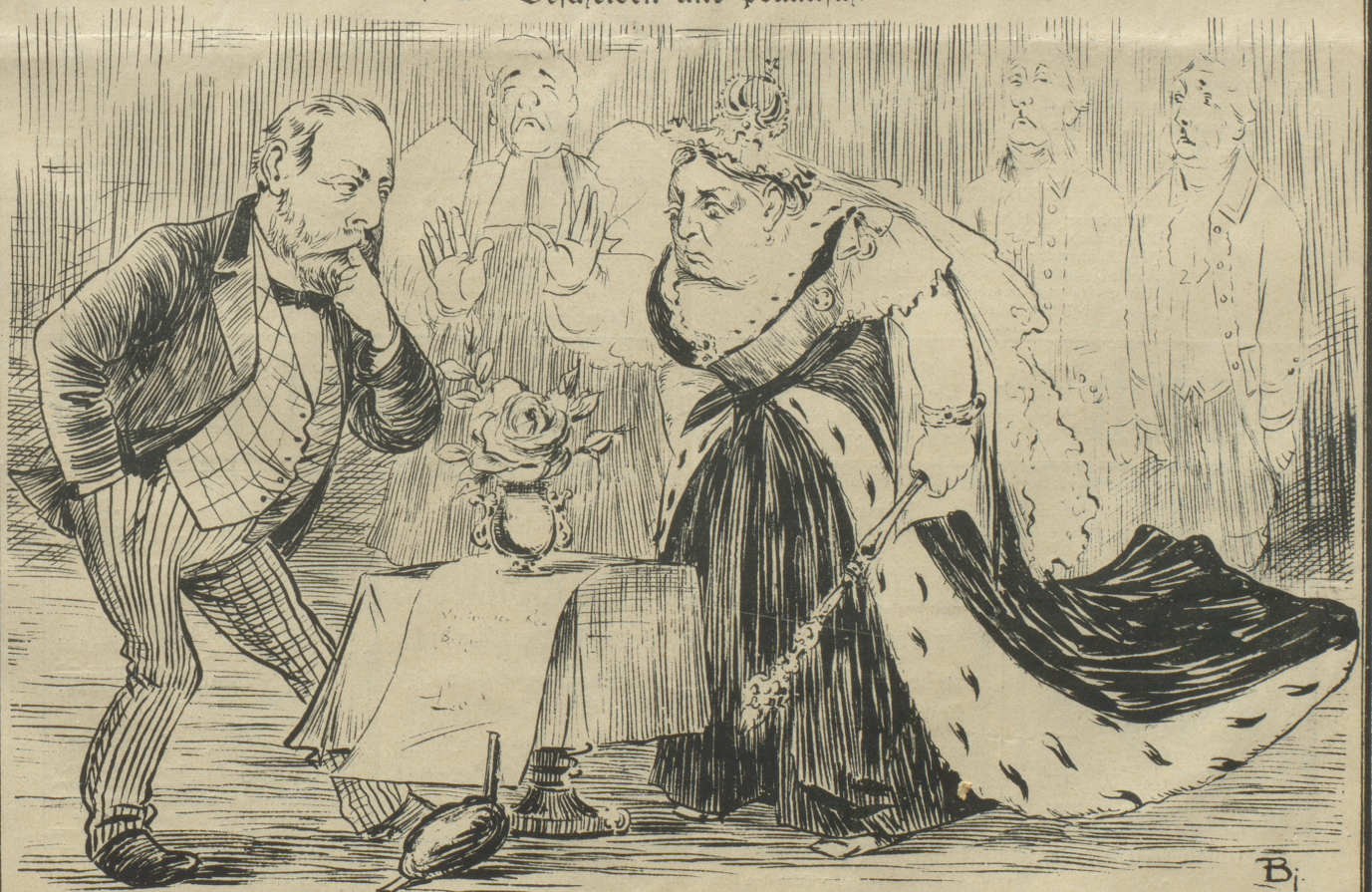
Viktoria: „Was, mir die Tugendrose geben wollen? Das ist doch unwer Wales: „Hm, liebe Mama, s ist echtes Gold, non olet!“