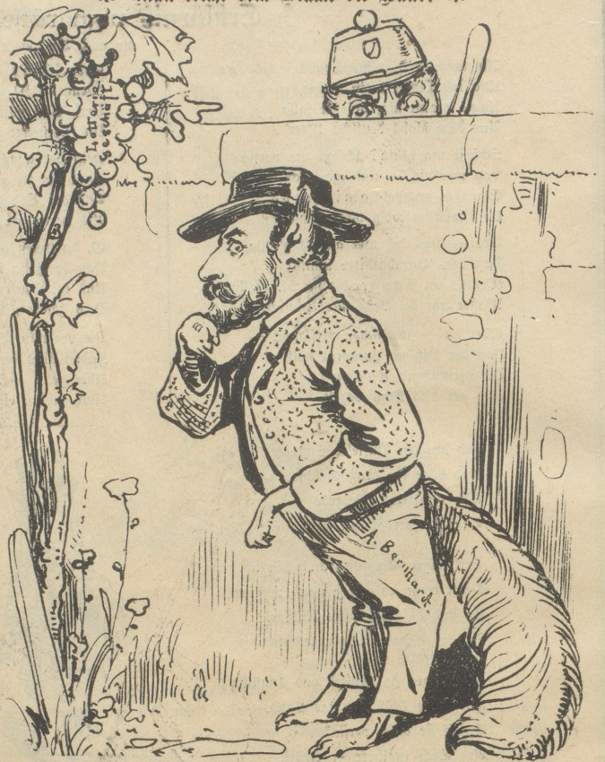
Der Fuchs möchte schon gern, aber die Trauben sind ihm alleweil doch zu teuer.