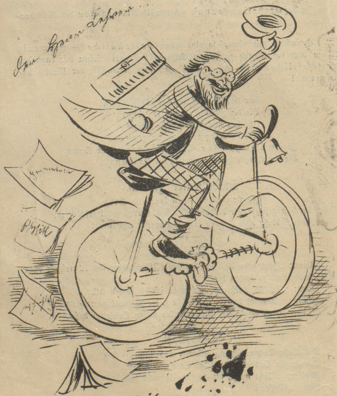
Lehrer: „Juhu, jetzt bin ich für vier Wochen die Stricke los!“