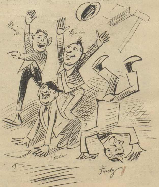
Schüler: „Juhu! Er häd ü endli i d'feria gstrichä!“