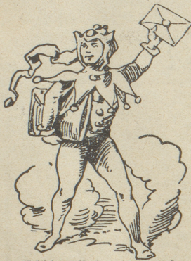
unglücklicherweise dargehan, daß er eben nur Gesandter, aber nicht ein Geschickter

R. P. i. G. Die Fertigstellung der großen Auflage des „Rebelspalter“ beansprucht zwei volle Tage und so sind wir leider außer Stande, das Portrait des neugewählten Mitgliedes des Bundesrates schon in dieser Nummer zu bringen. Wir müssen Sie also auf die folgende vertrauen. — Oho. Mag sein, daß Ihr Gedicht sich mit den Schiller'schen „Elaboraten“ ruhig messen kann, aber deshalb verwenden wir doch keine Frankomarte, es sei denn, daß Sie uns eine schicken, um Sie wieder in den Besitz dieses „Schäzes“ zu bringen. — Kurg. i. B. Sie sollten nicht so schimpfen über das Pfister, sonst machen Sie sich verdächtig. Es heißt nämlich ein Sprüchlein: „Wer in dr Jugend liebt die wyße Wei, de fürcht im Alter d'Wefzistei.“ — B. i. B. Der Herr Gesandte hat sich mit seiner Rede bei den Franzosen einschmeicheln wollen und dabei