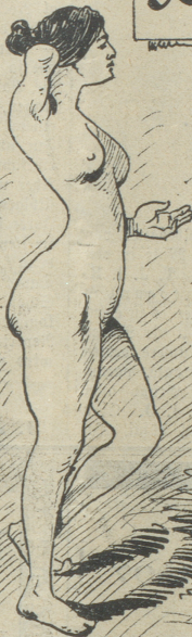
Eine arme Waise ohne recht zum anziehen u. keinen rechten Arm mehr hat, bittet um ein Almosen.