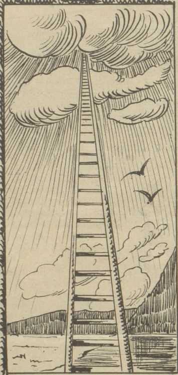
Aufstieg am Walensee. Himmelsleiter.