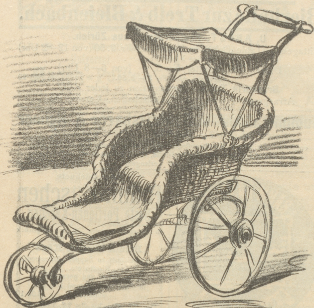
für Regierungshäupter zur Besichtigung der grauenvollen Zerstörungen von nächstlichen Revolten.