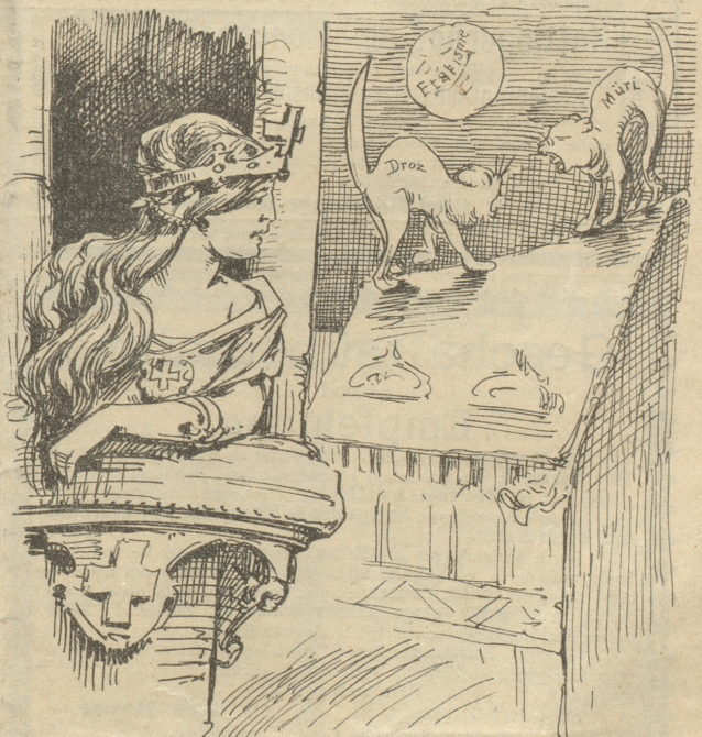
Elisa-Helvetia: „Welch' fürchterliches Klagen schallet durch die Nacht?“