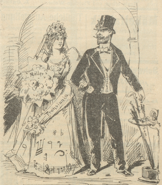
Die neueste Fuston — — „für's Leben“, Die „Scheidung“ — wird sich später geben.