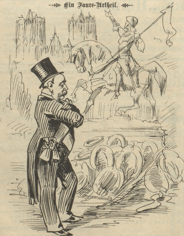
Faure (beim Denkmal der Jungfrau von Orleans): „Ausgezeichnet, wirklich; erst als Hege verbrannt und jetzt Denkmal! Sacre bleu, werde ich, dem man die Hölle täglich heißer macht, erst ein Denkmal friegen!“