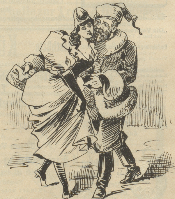
„Leh'n Deine Wang' an meine Wang', Anlehen sind ja heut' im Schwang!“