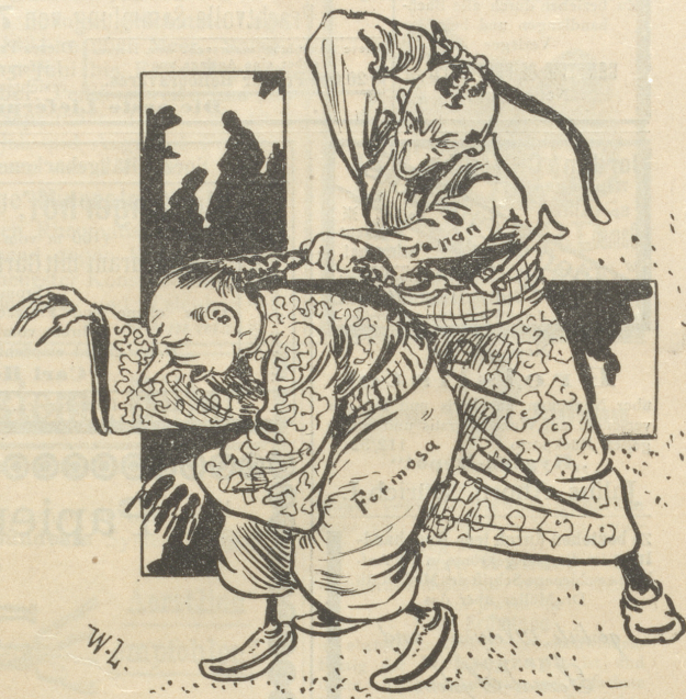
Japan: „Komm' Du verfluchter Kerl, Du! Erst werd' ich jetzt meine Wuth an Dir auslassen!“