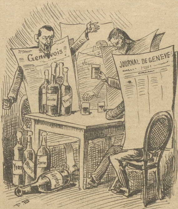
Der von den Genfern erhobene Kriegsruf: „Nieder mit den Waadtländern!“ begeistert selbst die Waadtländer.