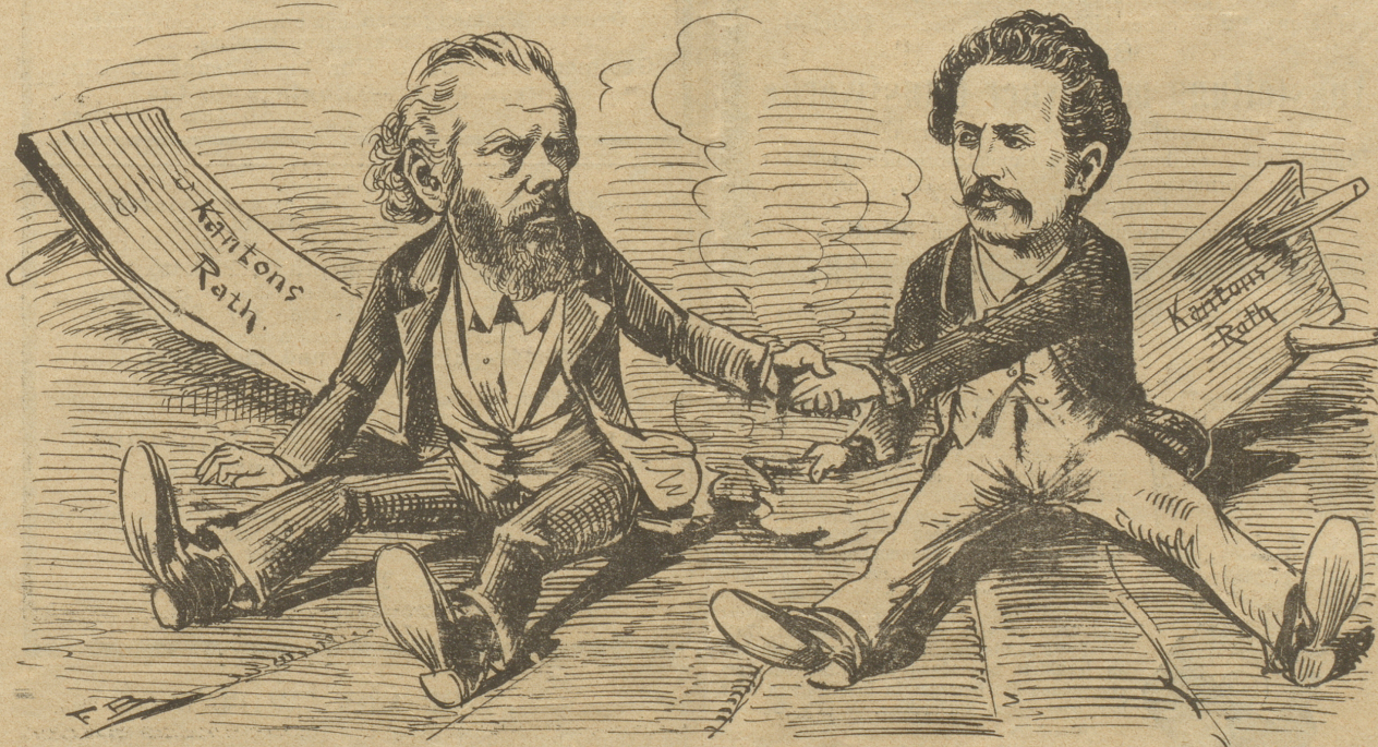
Greulich und Heidel: „Bruder, reich die Hand zum Bunde, nu simer alle beede unde; jekt heißt es wieder vorwärts seh'n, vielleicht gibts noch ein Aufersteh'n!“