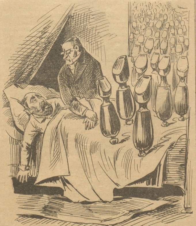
Arzt (zum fiebernden Eisenbahndirektor): „Herr Direktor, ich chan Ihre nüüd helfä, Sie händ d'Pfyfelikranket. Chünd Sie uf besserä, denn besserets scho!“