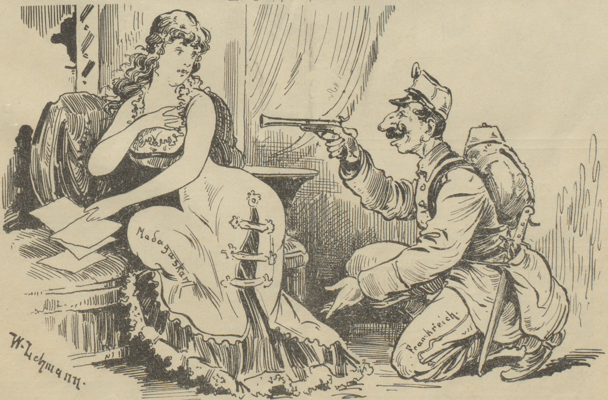
Frankreich zu Madagaskar: „Nicht wahr, schöne Frau, Du liebst mich und wirst mir ewig treu bleiben?“