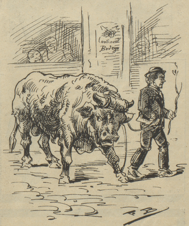
4. Da neigte der Stier sein stolzes Haupt, ging zerknirscht retour und ließ sich willig zum Tode führen.