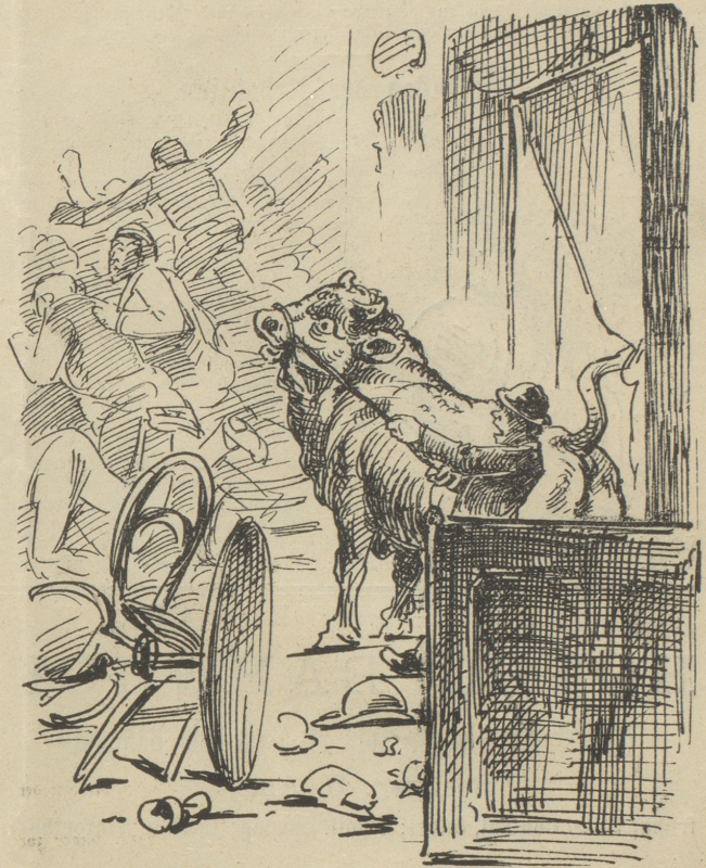
2. aber, o Schrecken, da kam einer herein und alles ergriff in heller Verzweiflung die Flucht.