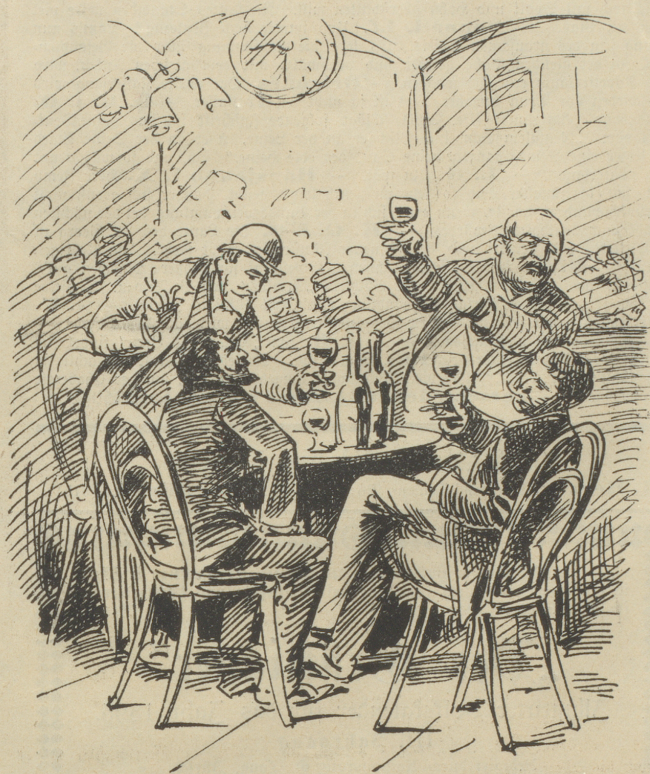
1. In fröhlicher Unterhaltung saßen sie und freuten sich des glücklich abgeschlagenen Bentezuges;

(Passirt in Zürich am 5. November und würdig der Verewigung.)