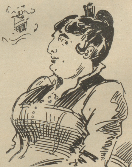
Braut, fin de siècle

Junges Fräulein, sich begnügend mit 2 Millionen, sucht die Bekanntschaft eines vermöglichen Herrn, 25 Jahre alt, mit oder ohne Kinder. Keine Agenten. Offerten unter X Y Z.