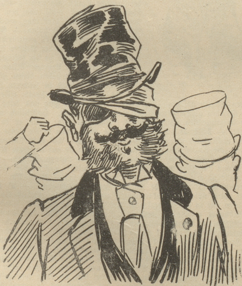
Deputirter, fin de siècle

Journalist oder Advokat, gibt und nimmt Faustschläge für die eine oder andere Meinung. Heute auf der Rechten, morgen auf der Linken und Anarchist übermorgen. Moquirt sich für den Rest.