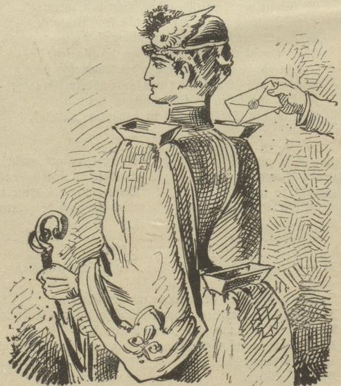
à la Briefeinwurf.