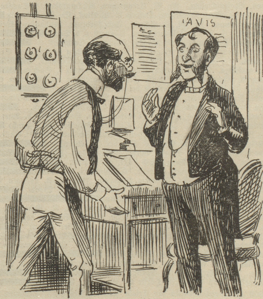
Auch ein Dieb.

„Oh, wieder Ministerwechsel in Frankreich! man weiß nicht, wie man diese Herren benennen soll —“ „Doch, doch — freiwillig Einjährige!“