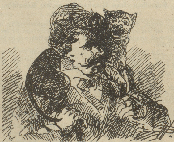
Wie der Bruder Zipfel seinen Comilitonen beweist, daß er nicht auf dem Hund sei.