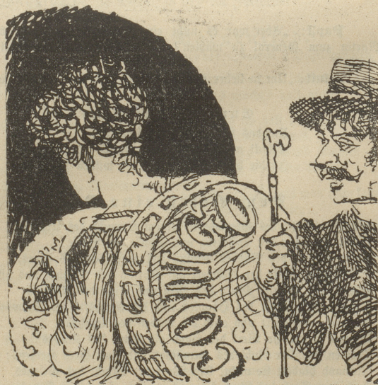
Früher wurden Bänder als Suivez-moi getragen, jetzt thut's eine afritanische Seifenschachtel.