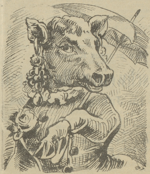
Wie man Eitelkeit pflanzt.

Man hat beschlossen, künftighin die Zeichnungen der Kühe durch Ohrenmarken vorzunehmen, was natürlich über kurz oder lang den „Ohrenglanggeren“ rufen wird.