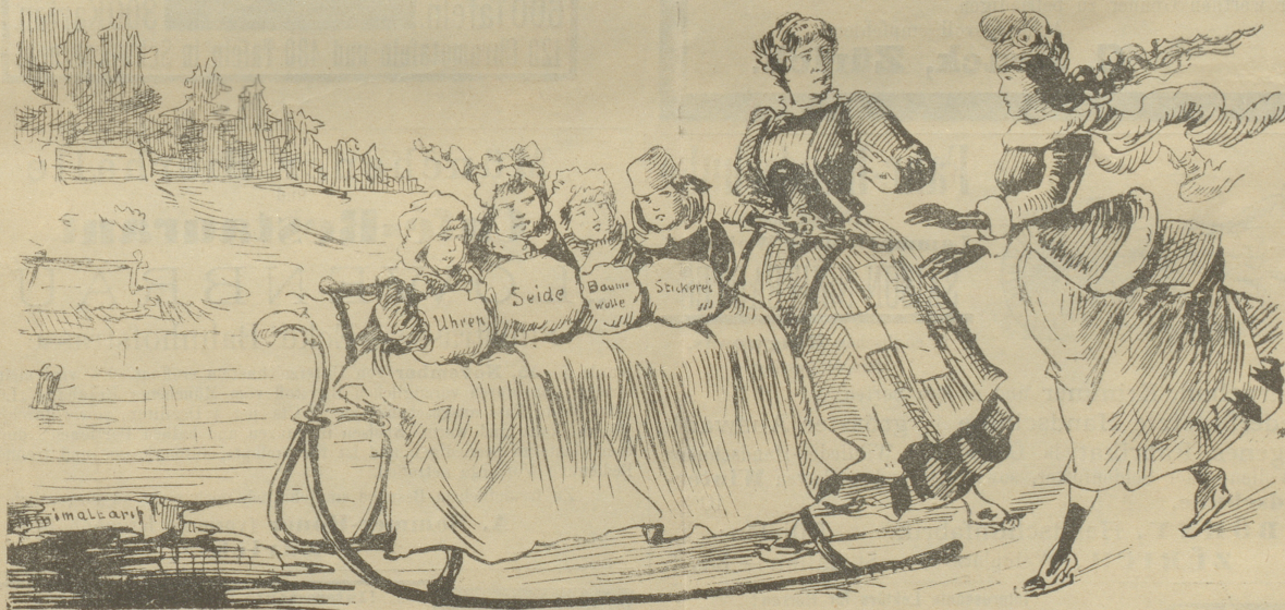
Zum französisch-schweizerischen Handelsvertrag.

Helvetia: „Pardon, liebe Nachbarin, den Schlitten muß ich Ihnen doch wegnehmen; Sie fahren ja da direkt auf das Loch zu! Das geht denn doch nicht.“