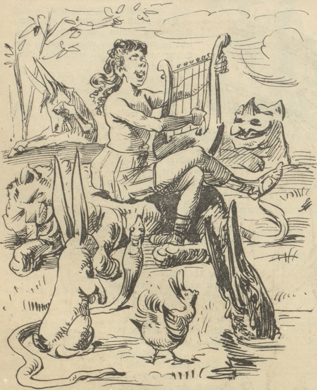
Die Macht der Musik.