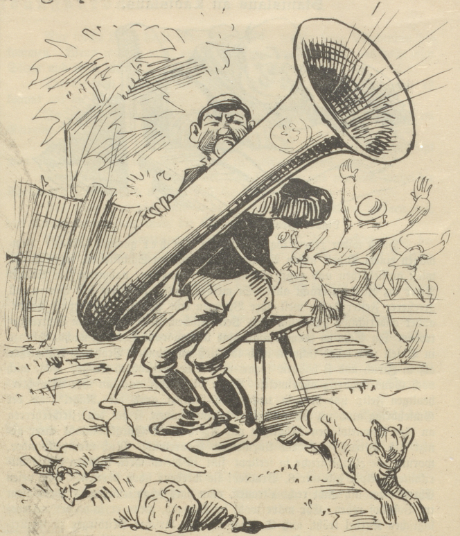
Der macht die Musik.