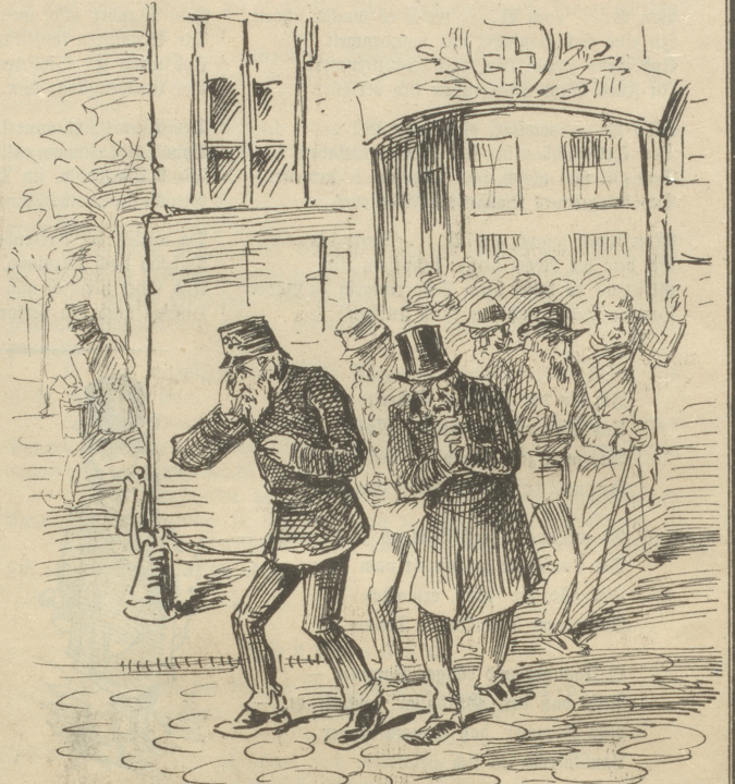
aber den braven Leuten, die arbeiten wollen, aber nicht mehr können, gönnt man keine „Pension“.