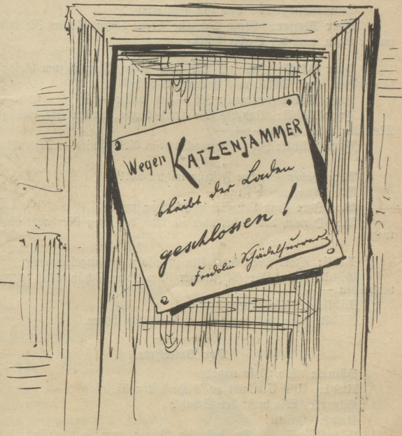
Wie ihm die Freunde in der Nacht den dargebrachten Becher quittirten.