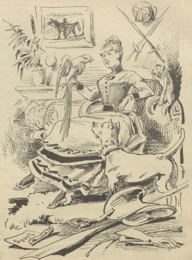
Jedoch zum Vornehmsein, das ist halt zweierlei, Behört ein Gaul, ein Hund, ein Aff und noch ein — Papagei.