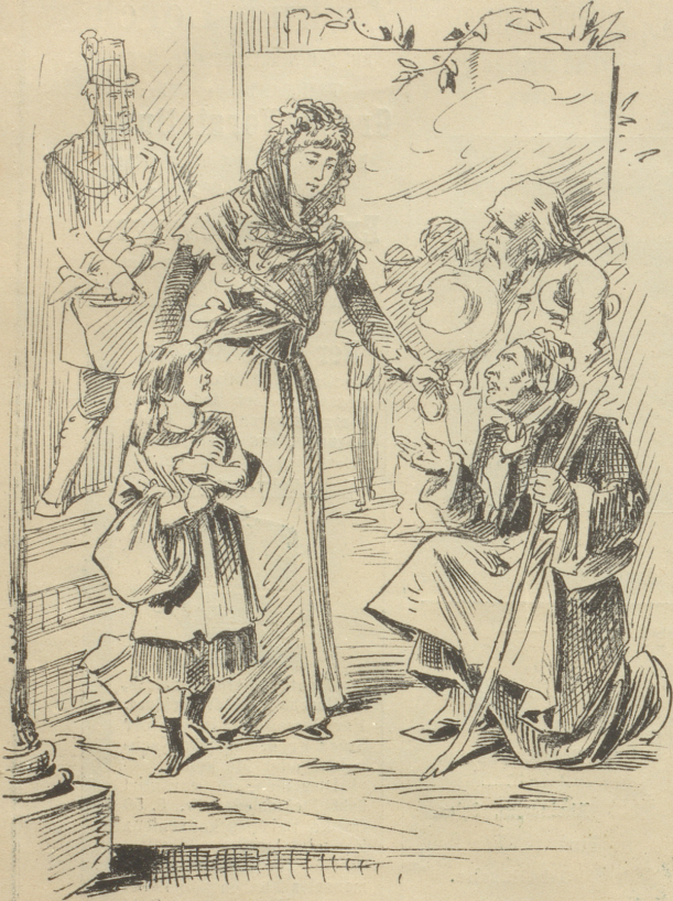
Zum Edelsein gebrauchs nur Herz und milde Hand, Der Edelmutz gebehrt auch in bescheid'nem Stand.