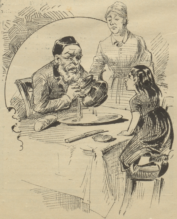
Vater: „Wenn nur der Teufel diese Theemaschine holen wollte!“