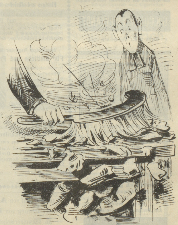
Stimme: »»Doch, doch, man fährt nur so d'rüber hin und es bleibt Nichts als der Fleck in der St. Galler Verfassung!«<