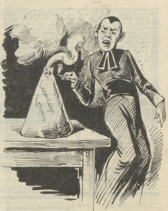
aber ein Funke und er fängt an in beängstigende Höhe zu steigen