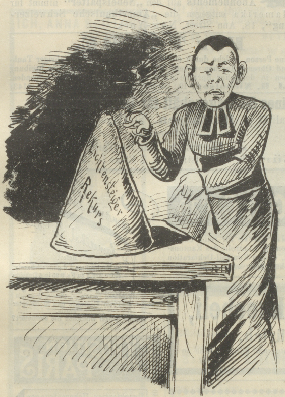
»Sehen Sie, meine Herren, das ist ein unscheinbarer Gegenstand ;