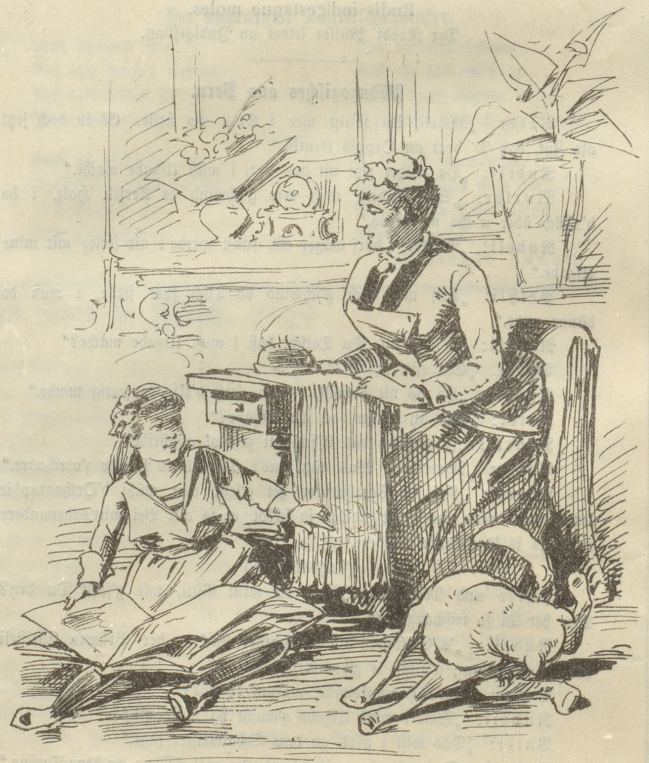
„Mamma, ist jetzt unsere Kaze auch hoffähig?“