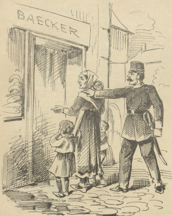
Wenn die Armuth für ihre Kinder Brod bittet, so ist das ein Verbrechen.