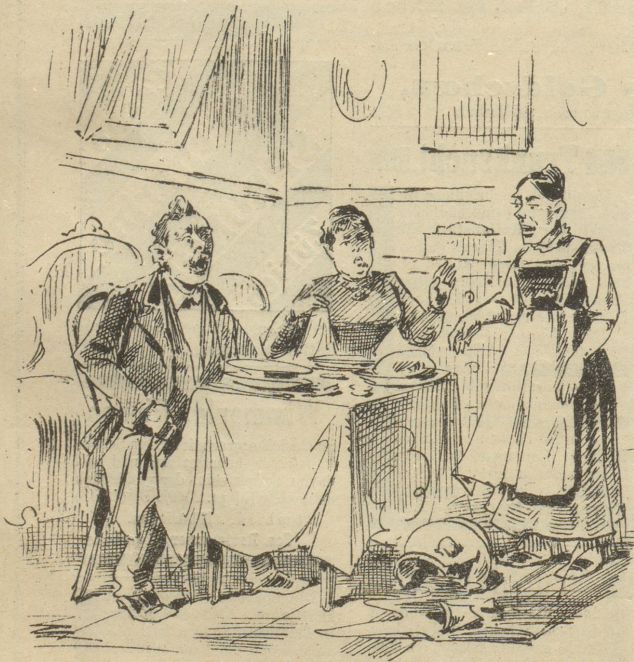
Hausfrau: „Unsere Pepi ist doch gar zu dumm! Zerbricht sie die nage! neue Suppenschüssel, die ich erst gestern gekauft habe.“