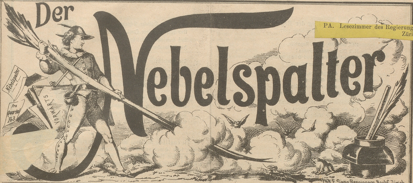
Lith. E. Senn Benningers Nachf. Zürich.

PA. Lesezimmer des Regierungsrathes, Zürich.