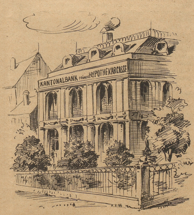
In Solothurn hat früher a Folter so ausg'schaut