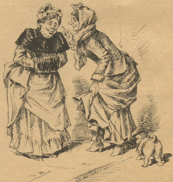
Auch ein Schauspieler.

„Frau Kremelmeyer, ich hab gestern im Theater auch Ihren Sohn auftreten sehn, aber er hat Nichts weiter gesagt, als: Es ist servirt, gnädige Frau.“