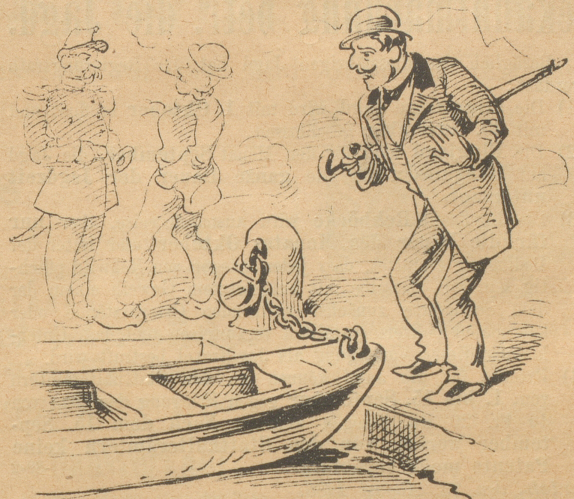
kein Schiff von der Kette gelöst;