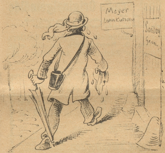
keine Kutsche eingespannt;