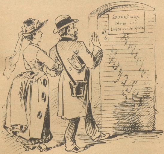
kein Laden geöffnet;