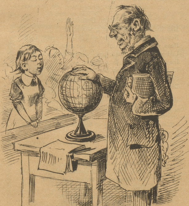
Aus der Schule.

Lehrer: Nichts übt das Auge besser, als das Abschätzen der Größe. Was meinst du Käseli, wie groß ist etwa diese Kugel? Käseli: Ung'fähr wie üsem Nachtwächter si Chropf.