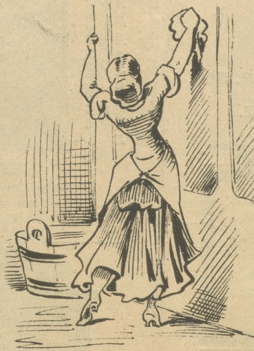
Arm u. Beinstrecken.