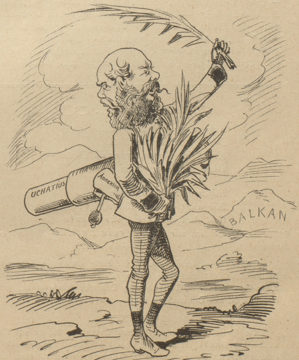
„So lange Oesterreich seine hinterlistige Politik nicht aufgibt, kann ich nicht sein Freund sein!“ (W. G. Gladstone.)