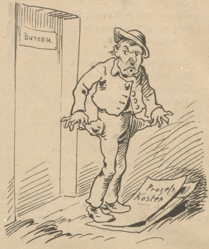
3. 'nes Jeden Recht ist sonnenklar; Er macht gern Nichts, wo Etwas war.