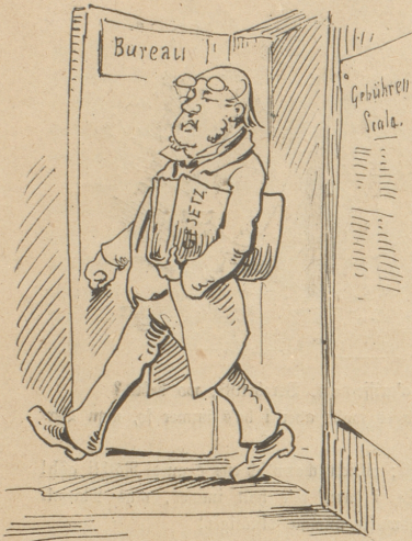
1. Als weiser Mann in Folio Tritt Morgens er in sein Bureau.