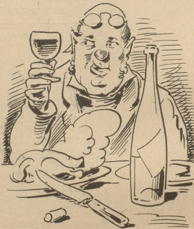
5. Dann macht der flotte Mittagstisch Zur neuen That ihn wieder frisch.