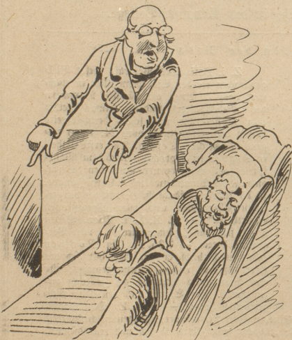
4. Nachdem er so verkauft sein Licht, Geht er plaidiren vor Gericht.