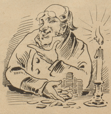
9. Und später noch beim Kerzenglanz Macht er vergnügt sich die Bilanz.