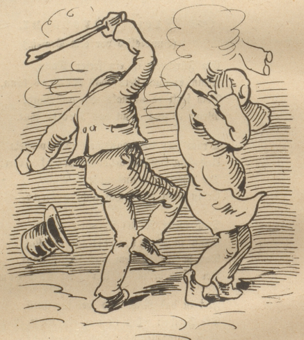
6. Weil er jüngst den Prozess verlor, Summt ihm gelegentlich das Ohr.