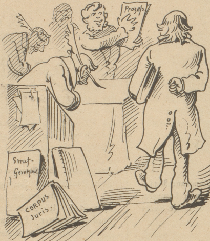
2. Die Schreiber knixen achtungsvoll, Die Clientel bringt ihren Zoll.