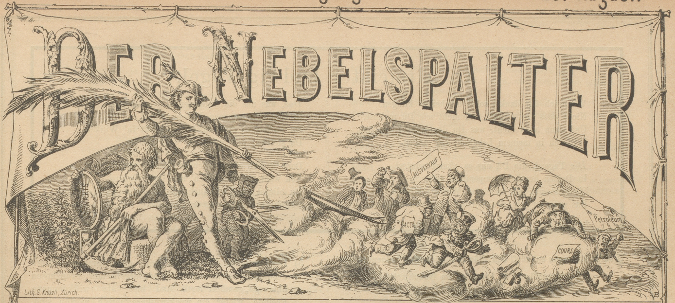
Lith. G. Knusi, Zürich.