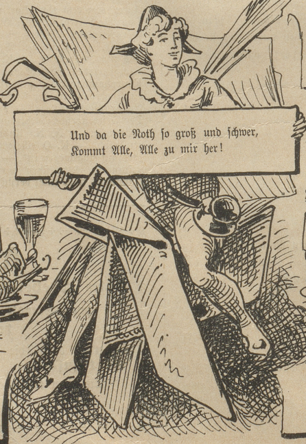
Und da die Noth so groß und schwer, Kommt Alle, Alle zu mir her!