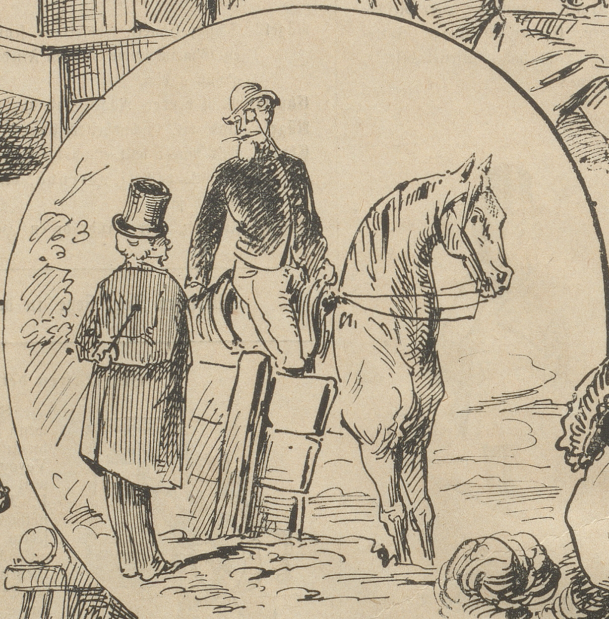
"Sie reiten, wenn so schlecht es sieht?" "Hab' keine Zeit, wenn Alles geht!"