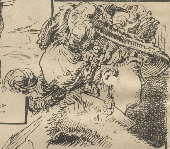
Daß größte Noth ist an dem Mann, Man leicht am Bild hier sehen kann.