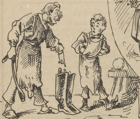
"Nein, Stiebeln trag' ich nicht mehr aus, kein Trinkgeld mehr kriegt man im Haus!"