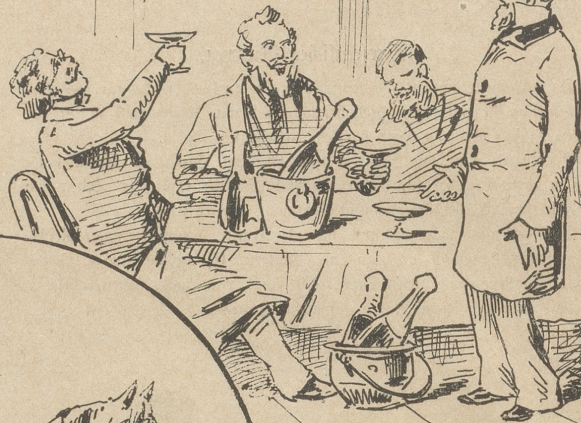
"Statt Schaffen, feiert ihr ein Mal!" "Sist nichts zu thun, Herr Prinzipal!"