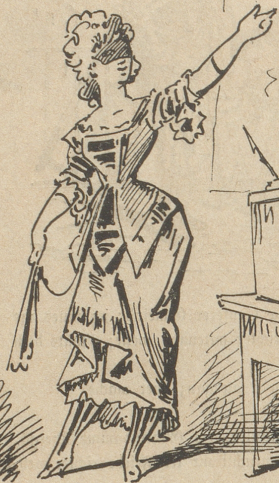
Zum Balle geht's; der Mann am Pult lebt sich indeß in der Geduld.